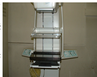
当院のマンモグラフィー装置